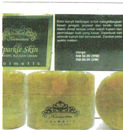
1. Karisma Turmeric Booster Cream