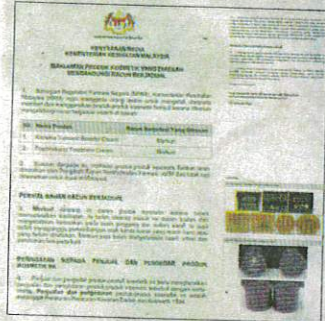
Kenyataan KKM mengenai produk kosmetik yang dikesan mengandungi merkuri.

"Orang awam digalakkan untuk menyema status notifikasi sesuatu produk kosmetik dengan melayari laman sesawang rasmi NPRF www.npra.gov.my atau melalui aplikasi NPRF Product Status yang boleh dimuat turun daripada Google Play Store," katanya.