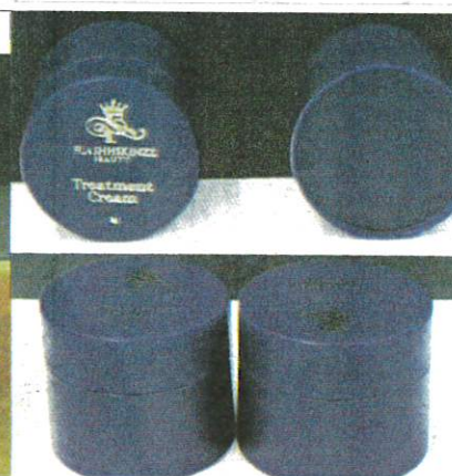
DUA produk kosmetik yang dilarang penjualannya selepas dikesan mengandungi merkuri.

mengganggu perkembangan otak kanak-kanak yang masih kecil atau yang belum dilahirkan, selain boleh menyebabkan ruam, iritasi dan perubahan lain pada kulit.