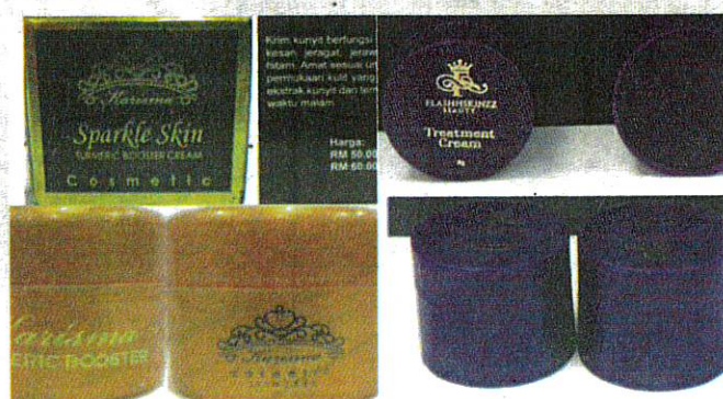
KARISMA Turmeric Booster Cream serta Flashskinzz Treatment Cream tidak dibenarkan dijual.

Individu yang melakukan kesalahan mengikut Peraturan-Peraturan Kawalan Dadah dan Kosmetik 1984 boleh didenda tidak melebihi RM25,000 atau penjara tidak melebihi tiga tahun atau kedua-duanya untuk